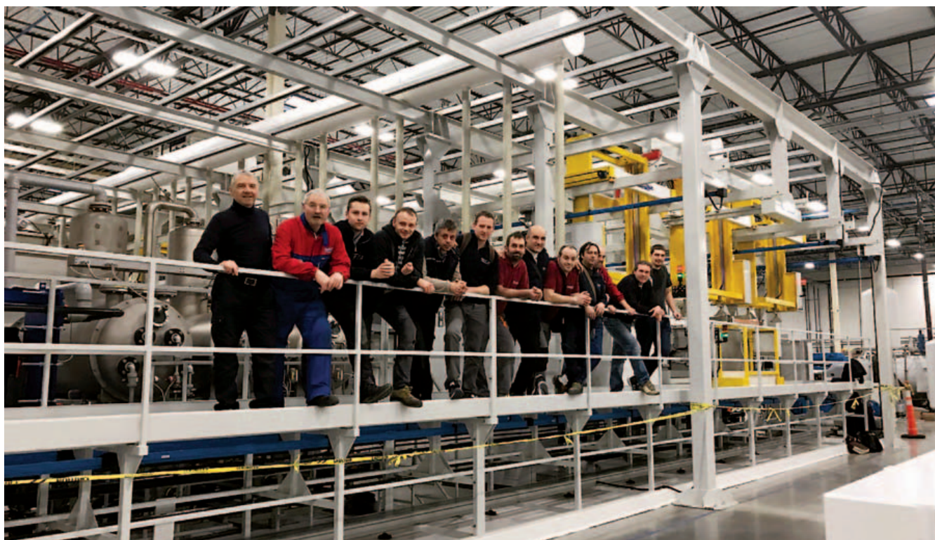
Ilmar, a eccezione della pneumatica e dei motori elettrici, realizza tutto internamente: lavorazioni meccaniche, parte elettrica e software.